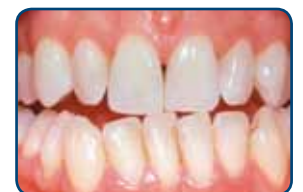
Resultaat na tien dagen bleken met de thuisbleekmethode onder begeleiding van de tandarts