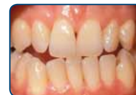
Voor het bleken

De lengte van een bleekbehandeling hangt af van de bleekmethode. Bij de thuisbleekmethode duurt het meestal twee weken voordat u een gewenst resultaat bereikt.